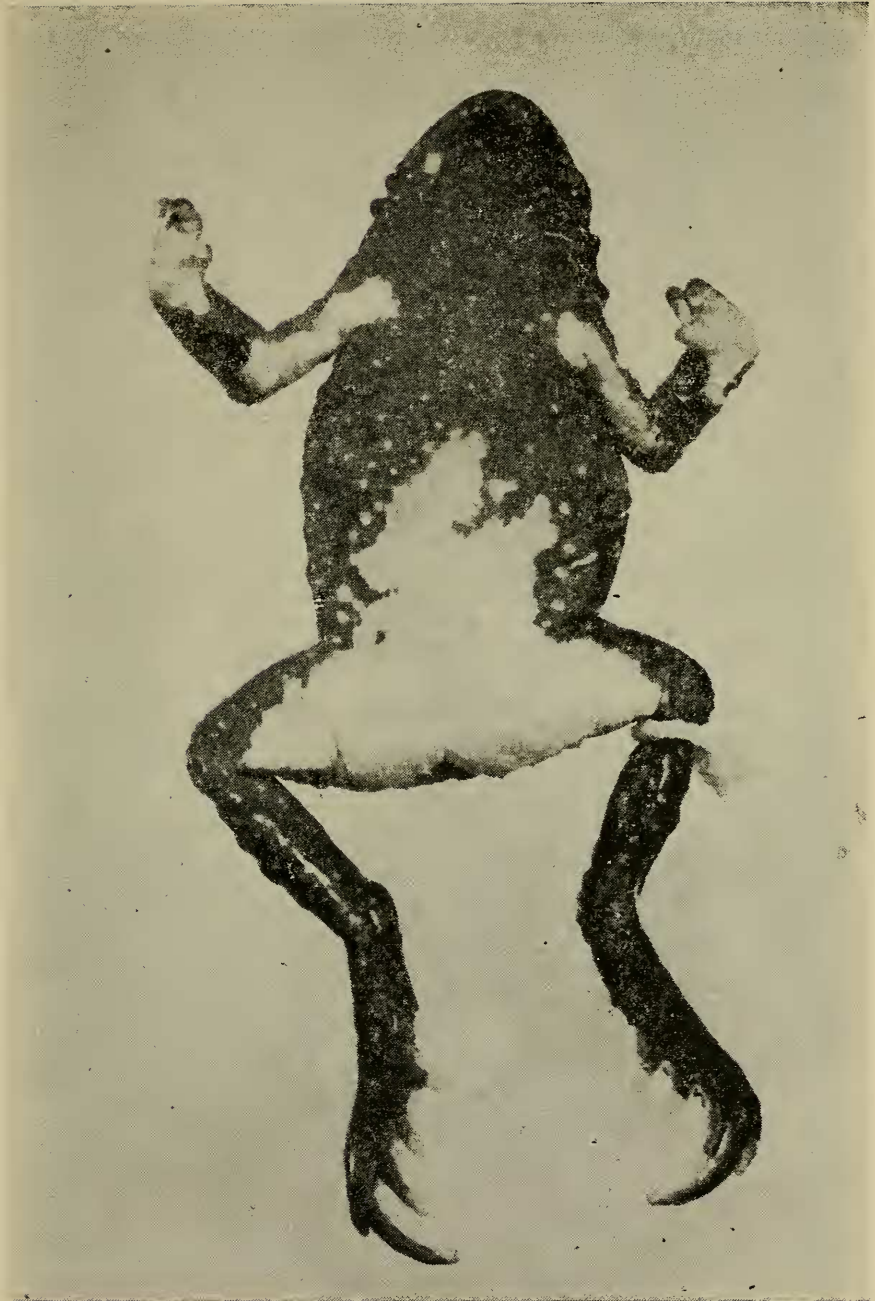
Figura N.º 2 — Vista ventral do Holótipo